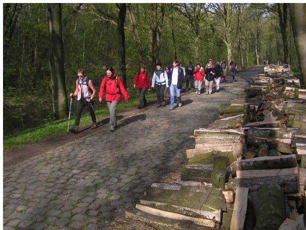
Randonnée de printemps à Palinbeek

Bonnes randonnées à tous et longue vie au Randonneur Club des Monts de Flandre.